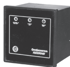
Преобразователь интерфейса RS-232/RS-485