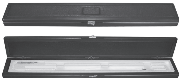
Футляр для ППО, ПРО (кожа, дерево)