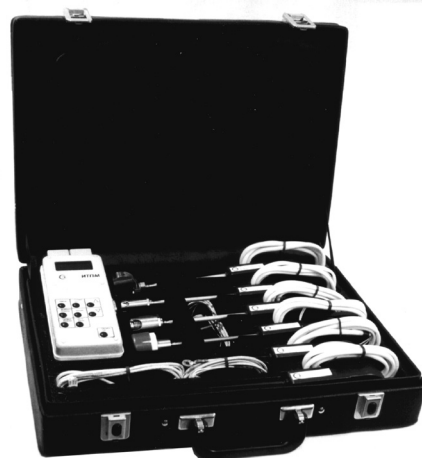
ИТПМ с комплектом датчиков в чемодане