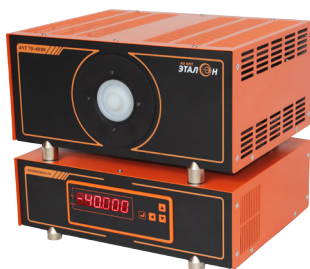
Рис. 4 Излучатель в виде модели абсолютно черного тела АЧТ 70/-40/80

Особого внимания заслуживает линейка излучателей в виде моделей абсолютно черного тела, которые позволяют перекрыть диапазон от -40 до +2500 °С. На рисунке 4 изображен излучатель в виде модели абсолютно черного тела АЧТ 70/-40/80.